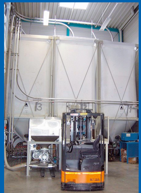
für Mahlgut ... für Agglomerat.