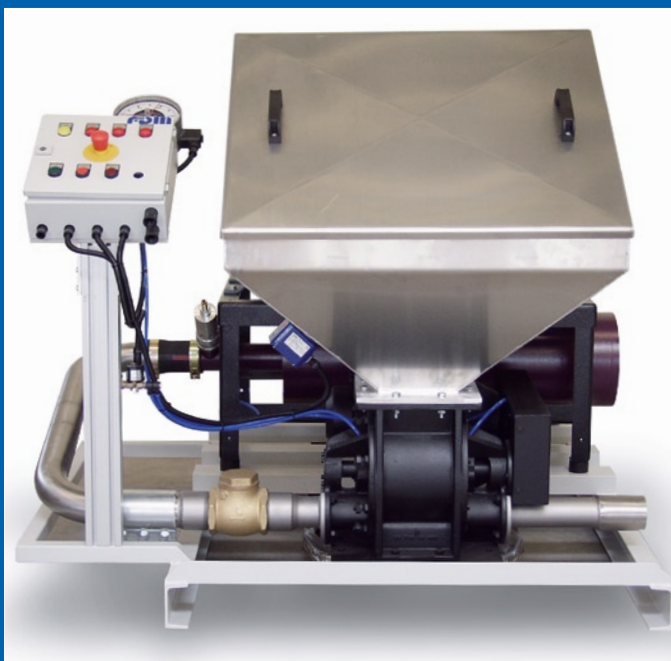
manuelle Sackaufgaben für gut fließende Schüttgüter