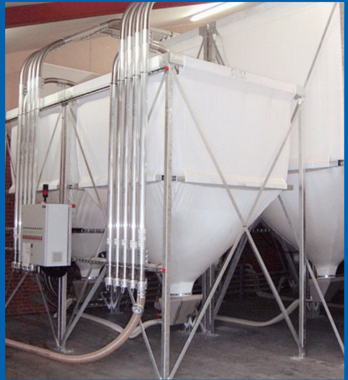
Silos für HD/LD zur Beschickung von Extrusionslinien

„In nur 2 Jahren hat sich die FDM GmbH zu einem der führenden Unternehmen in der Herstellung von flexiblen Innensilos und Materialhandlungssystemen entwickelt. Dank der langjährigen Erfahrung unserer Spezialisten konnten wir eine Basis für eine optimierte Planung und Produktion schaffen, für die wir heute weltbekannt sind.“