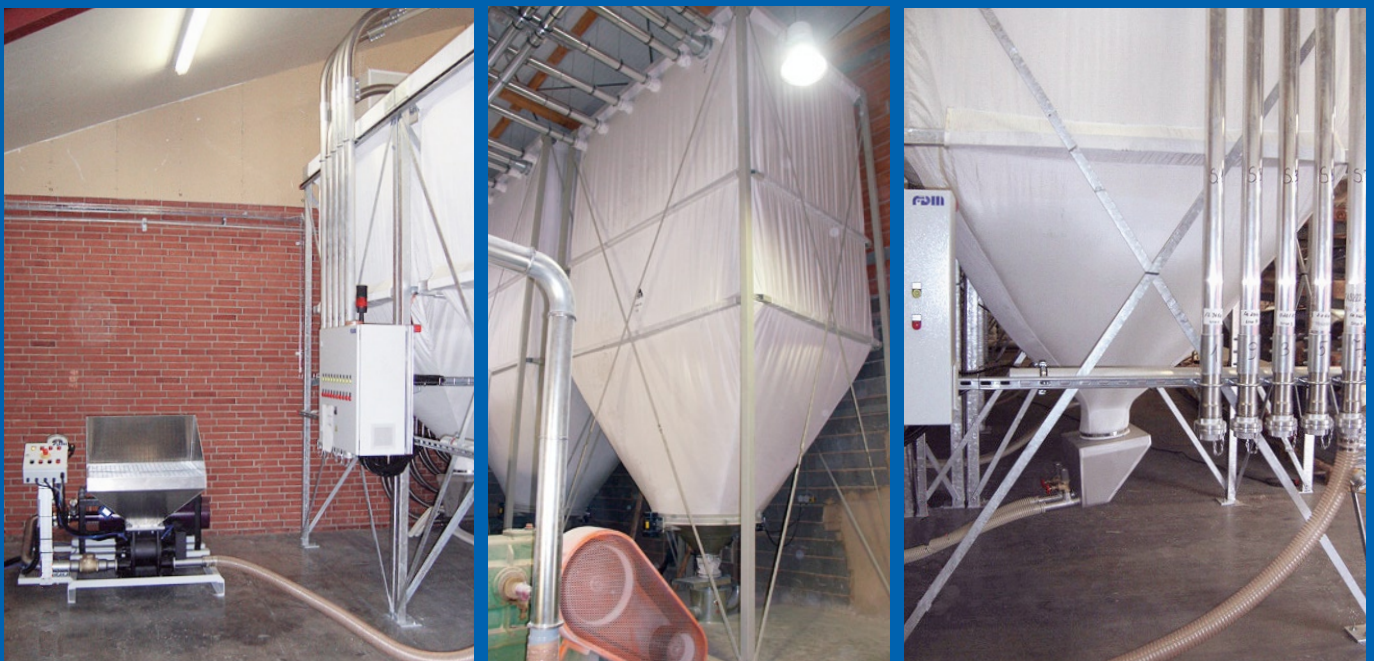
Innensilos für spezielle Anwendungen, kundenspezifisch ausgeführt.