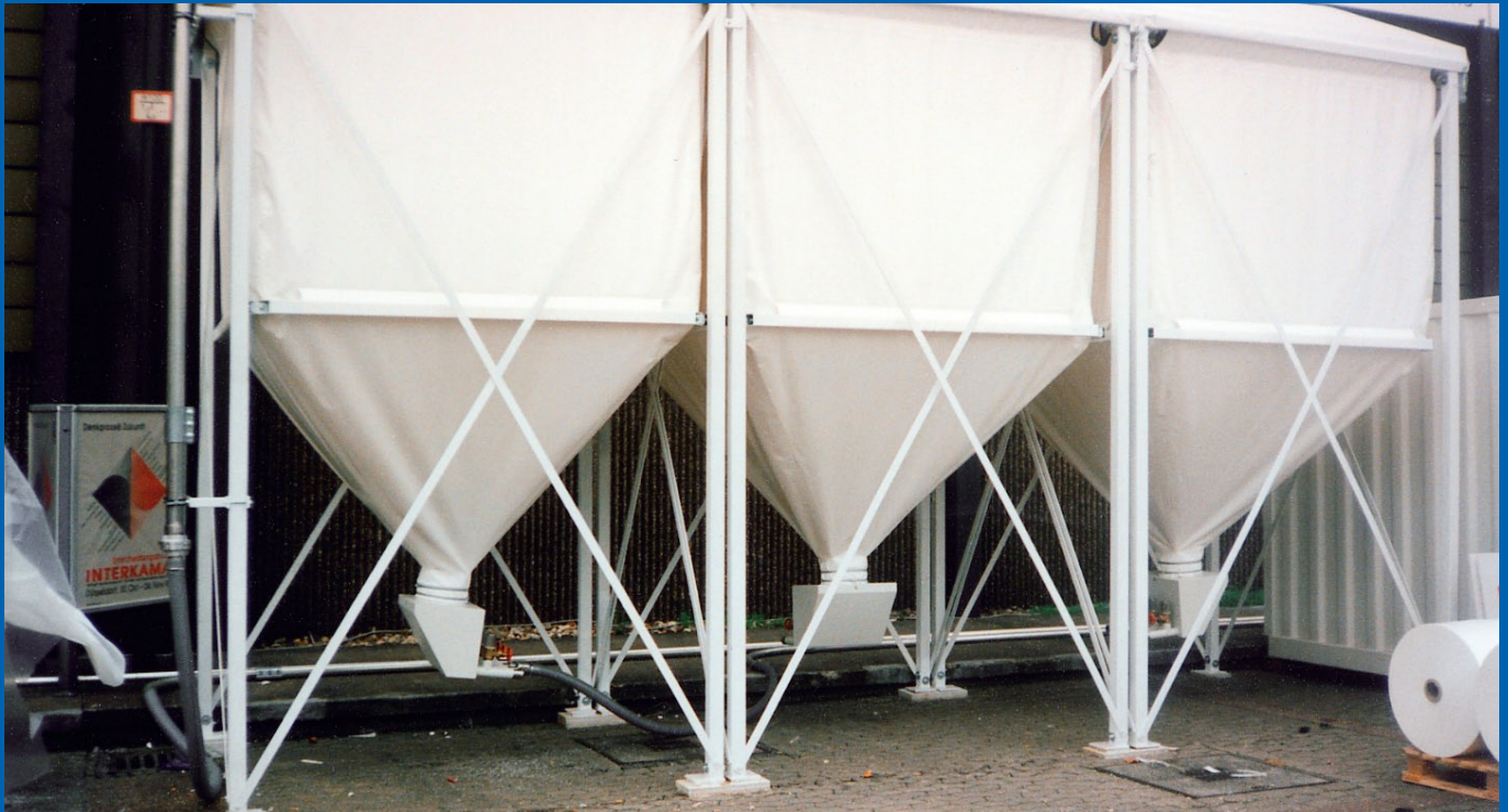
Speziell beschichtete Innen-/Außensilos mit Überdachung für Granulat