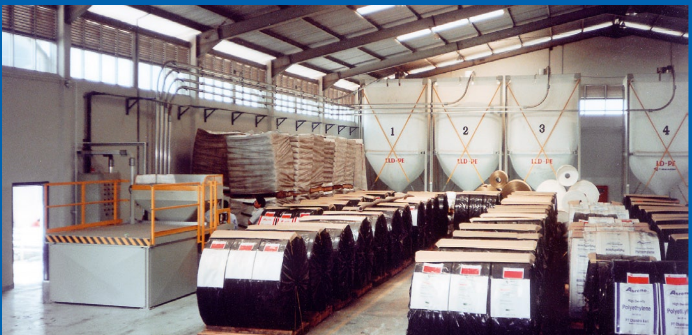
LDPE und LLDPE-Innensilos für Folienproduktion mit automatischer Außensilobeschickung

„Unsere Mitarbeiter zeichnen sich durch dynamisches Engagement und innovative Designlösungen aus.“