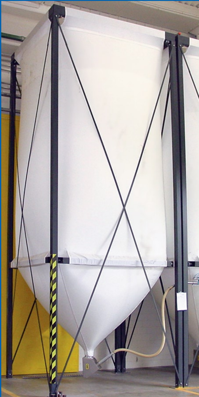
Tagessilo für ABS Spritzgussproduktion