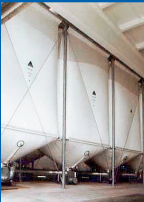
Innensilos für Granulat ...