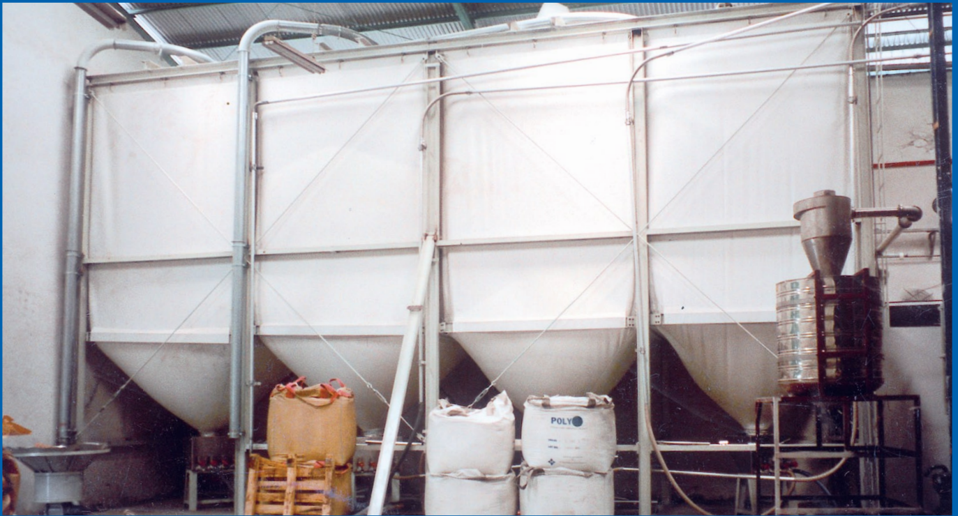
PET Neeware und Mahlgutlagerung in Indonesien, kundenseitiger Stahlbau