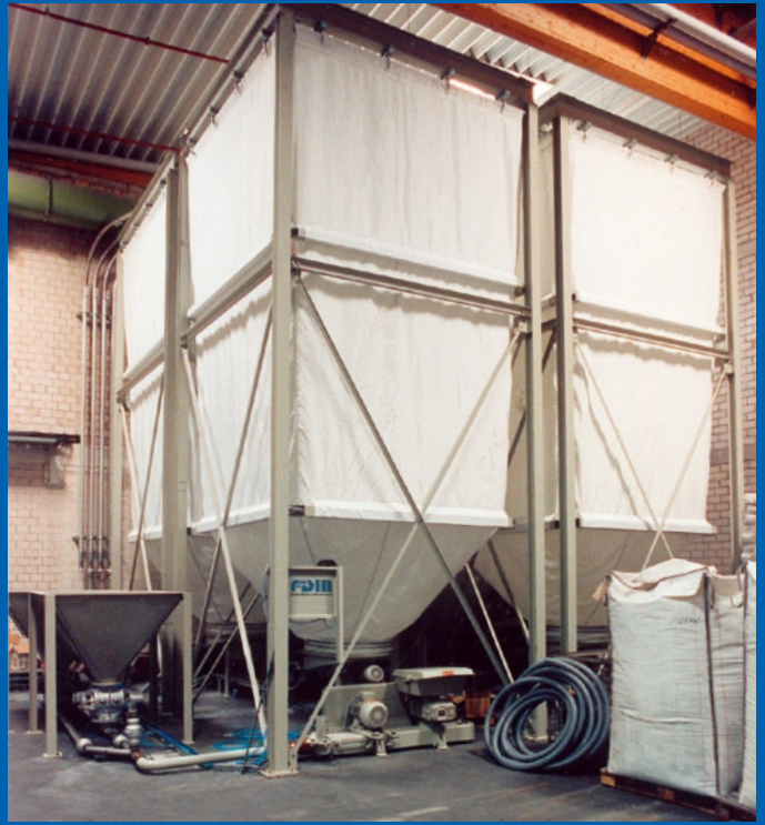
Silos bis 60 m 3