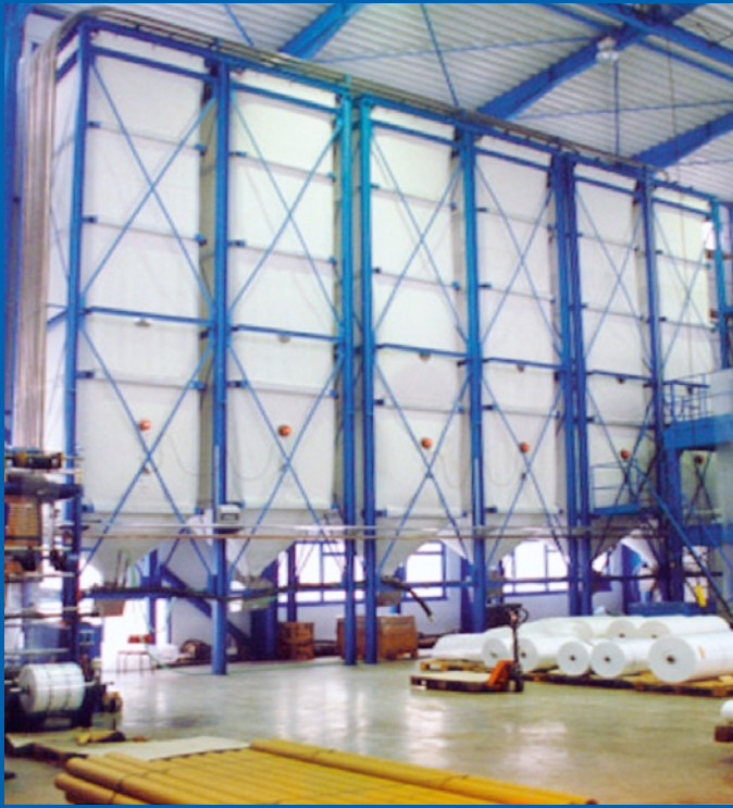
Großsilos für Blasfolienproduktion